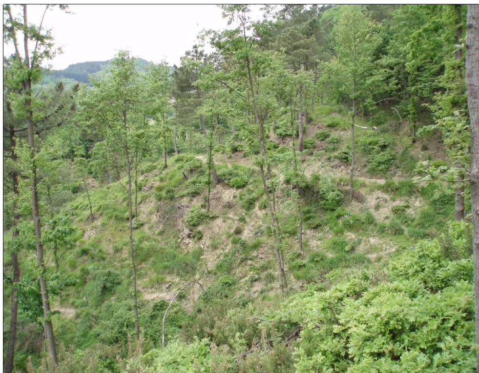
Fig. 2 - Effetti della brucatura del cervo in un ceduo matricinato di cerro della Val di Bisenzio a tre anni dal taglio delle ceppaie.

ginano terreni profondi e ricchi di humus, a reazione subacida-neutra. I suoli dei rilievi della Calvana, a pH alcalino, sono soggetti al fenomeno del carsismo ipogeo e epigeo, con formazione di grotte e cunicoli sotterranei per tutta la catena montuosa.