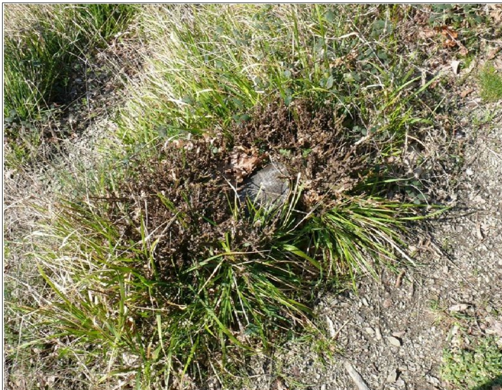
Fig. 1 - Ceppaia di cerro ripetutamente brucata in un ceduo della Val di Bisenzio.

La situazione osservabile nei boschi della Provincia di Prato, ed in particolare nei boschi cedui di specie quercine della fascia boscata che comprende la Val di Bisenzio e la zona appenninica del comune di Montemurlo, indica una pressione molto forte. Boschi cedui tagliati da alcuni anni sono caratterizzati da ceppaie molto brucate che, a causa del morso ripetuto degli ungulati, si presentano come cespugli bassi e densi, dall'incerto avvenire (Fig. 1 e Fig. 2). In certe aree, poi, il livello di danneggiamento è talmente elevato che, qualora l'impatto si prolungasse nel tempo, potrebbe determinare l'innescò di fenomeni regressivi assai pericolosi in chiave di salvaguardia ambientale.