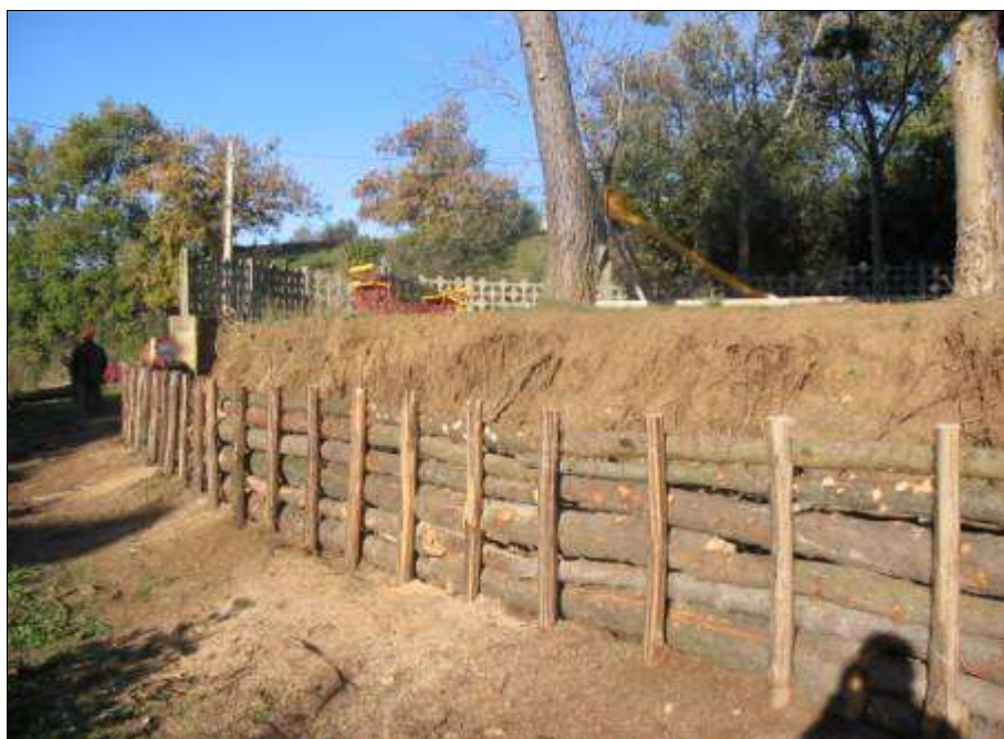
Fig. 14 - Opere di contenimento e sistemazione di versanti con palizzate costituite da materiale di risulta (Grassano – MT).

L'Ente attua interventi di prevenzione diretta degli