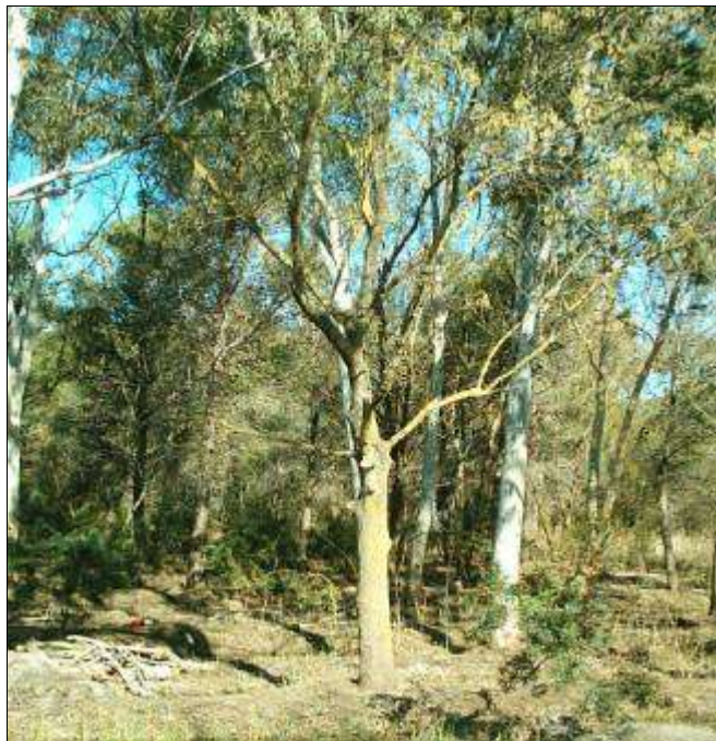
Fig. 11 - Interventi di eliminazione graduale degli eucalitti in presenza di rinnovazione di conifere mediterranee (rimboschimento misto, litorale jonico).

criteri di taglio di tipo geometrico – selettivo.