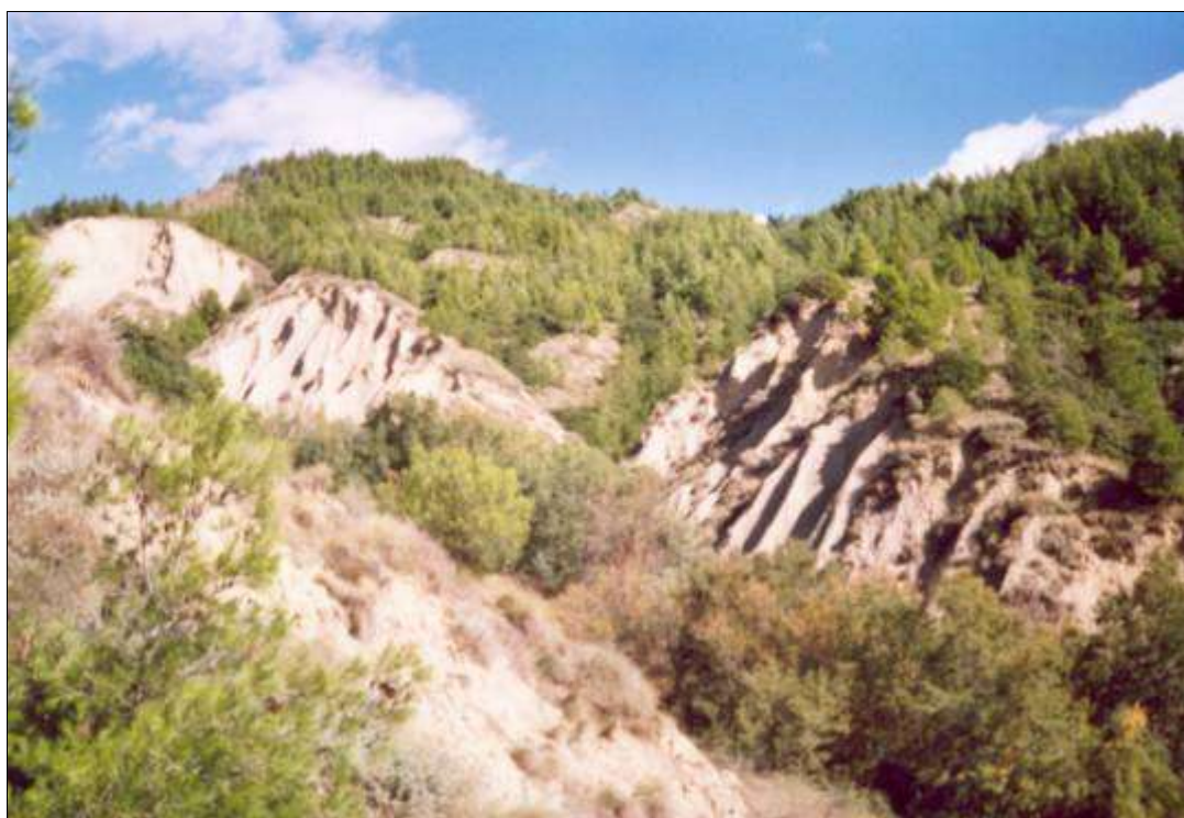
Fig. 8 - Tipico aspetto di area calanchiva (comune di Salandra).

Per i primi si rende necessario procedere ad interventi di diradamento; nei rimboschimenti esistenti tale aspetto è stato in generale molto trascurato; sono frequenti le situazioni di densità eccessiva o disforme che hanno provocato, soprattutto nei popola-