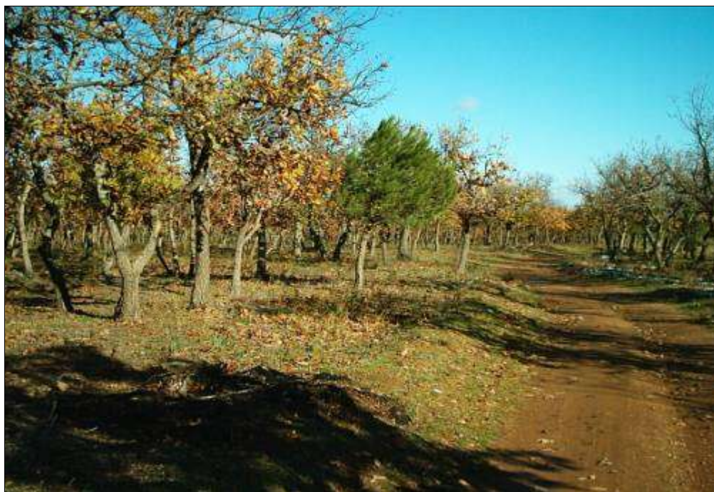
Fig. 5 - Ceduo semplice a prevalenza di Q. pubescens (Ferrandina).

resentano i rari casi in cui è possibile osservare la flora erbacea caratteristica a Carex spp (fig. 2B).