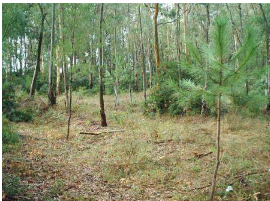
Fig. 10 - Un esempio di intervento di diradamento finalizzato alla diffusione ed alla rinnovazione di latifoglie autoctone in impianto artificiale, in primo piano pianta adulta di Frassino ossifillo (litorale jonico).

In molti casi, le condizioni di densità eccessiva dei popolamenti artificiali, che rispecchiano il sesto di impianto originario, impongono metodi operativi più schematici adottando, per quanto possibile, dei