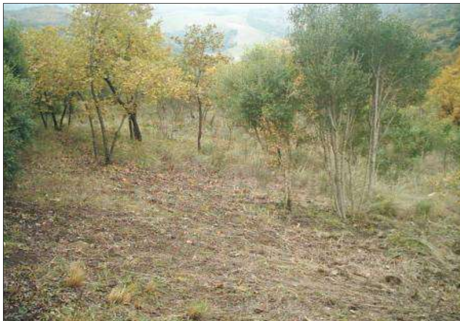
Fig. 7 - Querceto degradato con abbondante presenza di sclerofille mediterranee (comune di Grottole).

appunto dalla codominanza di Fraxinus ornus e Ostrya carpinifolia . In Lucania, dove peraltro gli Orno-ostrieti non sono molto diffusi e piuttosto rari nel materano, queste formazioni risultano arricchite dalla presenza di Carpinus betulus e di C. orientalis come si riscontra nelle aree più fresche delle piccole dolomiti lucane, nella valle del Basento.