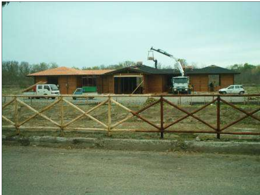
Fig. 15 - Fase di realizzazione di una struttura da adibire ad ecomuseo (Riserva Bosco Pantano).

incendi tramite operazioni selvicolturali e la realizzazione o l'adeguamento di viali tagliafuoco.