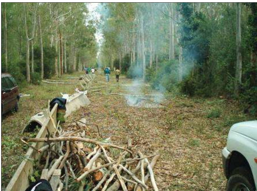
Fig. 12 - Creazione di viale tagliafuoco in rimboschimento misto (litorale jonico).

Per i boschi spontanei, che sono rappresentati, in maggior misura, da cedui di querce caducifoglie dell'orizzonte mediterraneo, si interviene soprattutto migliorando le condizioni di densità, intensificando la matricinatura e, nelle situazioni potenzialmente favorevoli, programmando interventi di avviamento all'alto fusto, per un migliore assetto ecologico complessivo di questi soprassuoli.