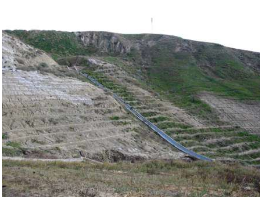
Fig. 13 - Lavori di sistemazione idraulico – forestale in aree calanchive (Grassano, MT).

Per i boschi degradati o danneggiati dal fuoco si procede al reimpianto con specie appartenenti alla flora originaria effettuando, ove le condizioni lo consentano, e con interventi di accelerazione dei processi di rinnovazione naturale.