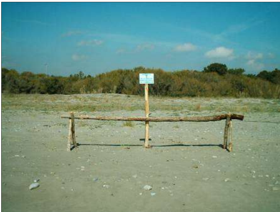
Fig. 17 - Barriere dissuasive in legno grezzo per la protezione della vegetazione psammofila.