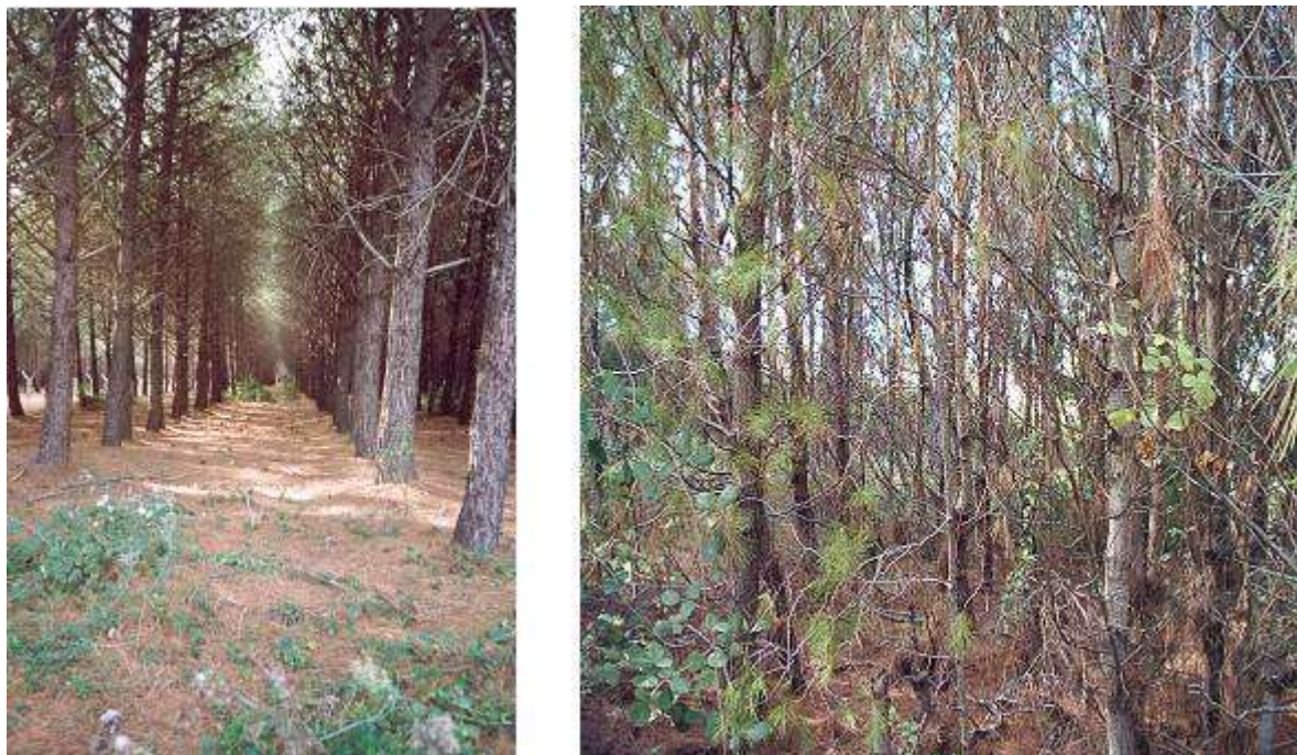
Fig. 3 - Alcuni aspetti relativi alle condizioni strutturali dei rimboschimenti di conifere.

molto spesso compenetrata a mosaico con la tipica vegetazione psammofila. La fisionomia tipica è quella della macchia bassa, che solo nelle situazioni più favorevoli assume una struttura di boscaglia per il maggior sviluppo delle specie arbustive e per la presenza di sporadici elementi arborei. Questa zona è fisionomicamente caratterizzata dalla dominanza del lentisco, del ginepro coccolone e da una notevole diffusione di agave, in particolare nella zona retrodunale dove si rinvergono anche piccole colonie di Juncus acutus . Sono inoltre diffusi, nel piano inferiore, il rosmarino, il mirto, il cisto di Montpellier che in alcuni casi forma dei piccoli gruppi puri, come si verifica per Artemisia variabilis . Più sporadiche risultano Phillyrea angustifolia e Thymelea irsuta , mentre, nelle aree più distanti dal mare, su suoli più maturi, si riscontra anche la presenza di Rhamnus alaternus , Phagnalon saxatile ed Helicrisum italicum .