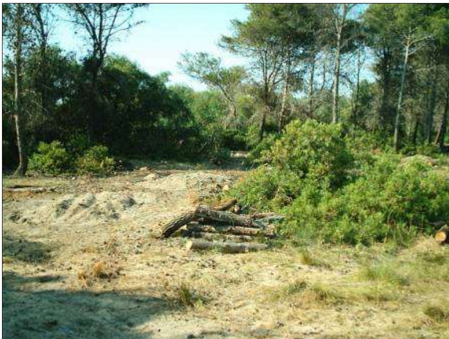
Fig. 4 - Pinete litoranee con evidenti lacunosità nella copertura a causa di massicci attacchi parassitari.

tribuita lungo tutta la costa Adriatica, dal Po fino alla Sicilia, dove accanto al frassino ossifillo si ritrovano frequentemente l'Olmo campestre e la Farnia (per Policoro si segnala la significativa presenza dell'Ontano nero e dei Pioppi), accompagnate da alcune specie caratteristiche quali Carex spp. e da diversi componenti xero-mediterranei come Smilax aspera , Ruscus aculeatus , Rubia peregrina . (fig. 2). Tuttavia per il bosco di Policoro si riscontrano anche dei caratteri attribuibili all'associazione Lauro-Fraxinetum angustifoliae per la presenza di alloro, generalmente consociato al Frassino ossifillo ed all'Ontano nero (De Capua 1995a).