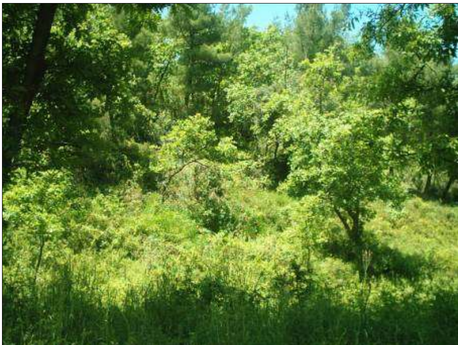
Fig. 6 - Situazione di disordine strutturale e presenza di vegetazione infestante che costituisce un fattore di rischio di incendi (bosco misto di latifoglie e conifere, Pomarico MT).

modesta o pressoché nulla. Una certa quota di novel-lame è costituita da specie secondarie (Alloro, Fico selvatico) o estranee alla flora spontanea (Robinia).