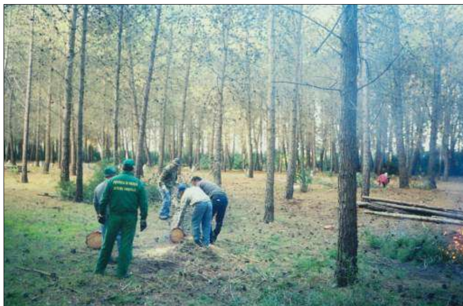
Fig. 9 - Diradamenti e spalcatore in soprassuoli artificiali di conifere.

menti monospecifici, delle situazioni di squilibrio e degrado. Si tratta in generale di diradamenti di debole intensità e di tagli a carattere fitosanitario (fig. 9).