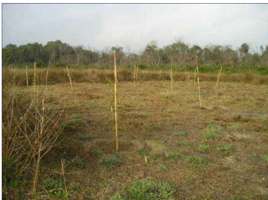
Fig. 16 - Impianto di specie arboree provenienti da seme autoctono (Frassino ossifillo) in aree percorse da incendio (Riserva Bosco Pantano).

La Provincia ha agito anche sui temi educativo ed informativo, importante aspetto che ha favorito il ridimensionamento del problema agendo sulle cause che sono quasi sempre legate a problematiche di natura sociale con stampa e diffusione di opuscoli informativi e manifesti affissi nei vari comuni.