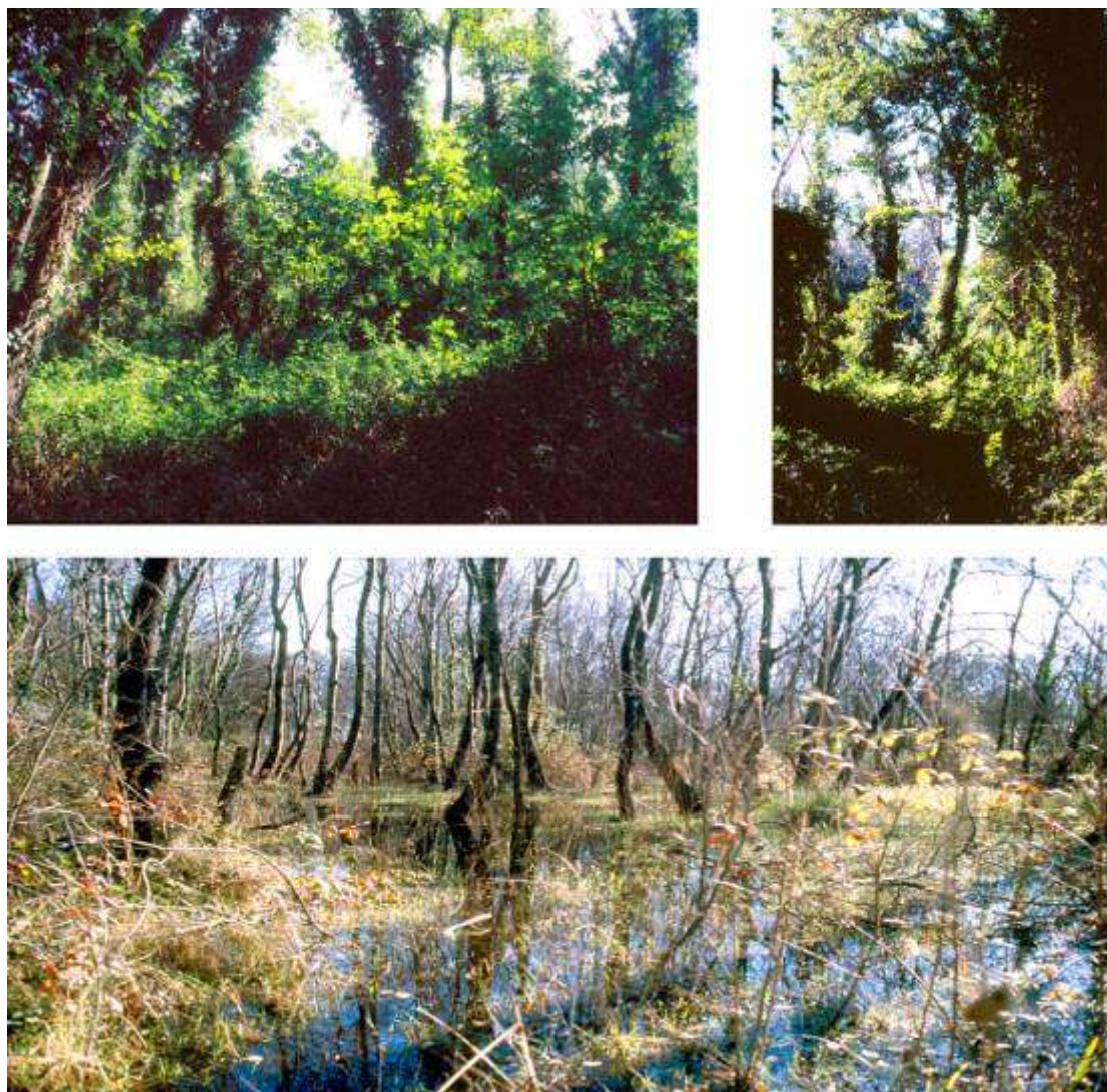
Fig. 2 - Due tipici aspetti del bosco planiziale di Policoro. Pannelli superiori: bosco mesoigrofilo misto con caratteristica presenza di specie rampicanti; Pannello inferiore: bosco igrofilo costituito da gruppi puri di frassino ossifillo.

sabbie pianeggianti per assenza di accumulo eolico. In particolare, Medicago marina si ritrova in piccoli raggruppamenti monospecifici anche in corrispondenza dei tratti più frequentati e disturbati del litorale. Da segnalare, inoltre, la significativa presenza in questa fascia di Ammophila littoralis .